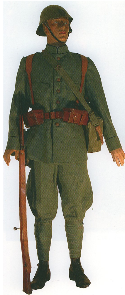
Nederlandse militair anno 1939-1940.

In ons kleine maar bijzondere museum krijgt u een andere kijk op de vesting Muiden en de historische omgeving.