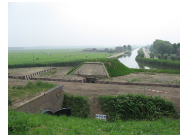
Uitzicht op de loopgraven en de groepsschuilplaats van het MMM.