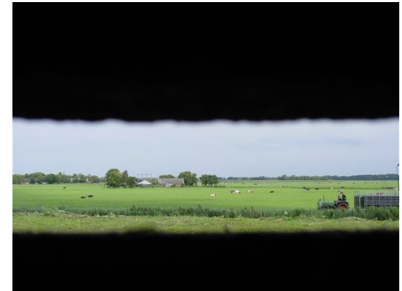
Een kijkje door de waarnemingskoepel van het MMM op de Noordpolder.

Het fort werd gemobiliseerd in 1914-1918 en in 1939-1940, maar er is nooit echt gevochten.